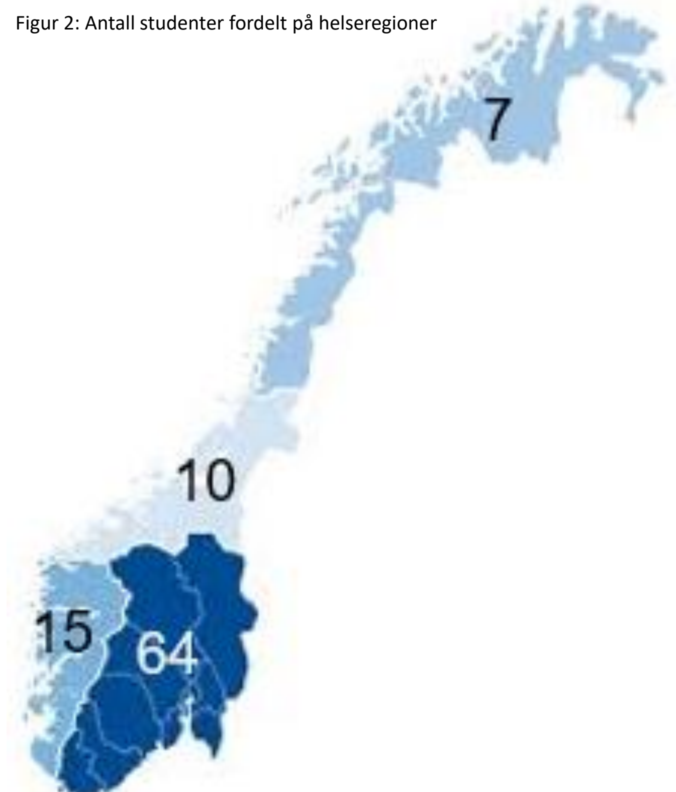
Figur 2: Antall studenter fordelt på helseregioner