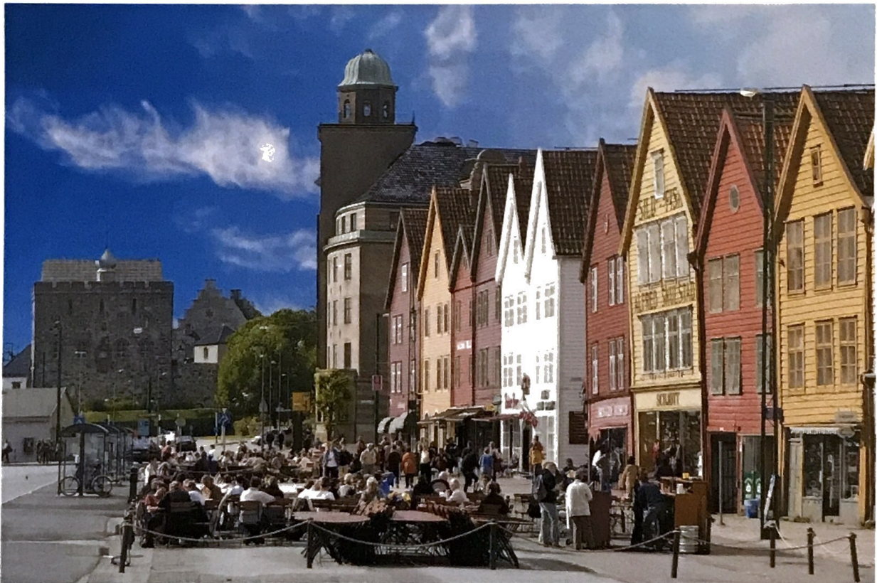
Figur 1Bilde av Bryggen i Bergen

Protokoll Generalforsamling Radisson BLU Royal Hotel Bergen Onsdag 6. september 2023 Kl.13.00-16.00